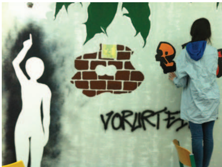
Graffiti zur Lerneinheit „Mauern aufbauen, abbrechen, überwinden“ (Mittelschule „Maria Hueber“ im Herz-Jesu-Institut Mühlbach)

In einem Projekt der Mittelschule „Maria Hueber“ im Herz-Jesu-Institut in Mühlbach setzten sich die Lernenden geschichtlich, geographisch, persönlich und kreativ mit dem Konzept „Mauer“ auseinander. Unter Verwendung der Sprachen Deutsch, Italienisch, Englisch, Französisch und Russisch und in Zusammenarbeit mit den Fächern Geschichte, Geographie und Kunst ging es um die Recherche geschichtlicher, geographischer und kultureller Hintergrundinformationen aus verschiedenen mehrsprachigen Quellen, um die Erforschung von Ähnlichkeiten und Unterschieden zwischen den Sprachen der Siegermächte im damaligen Berlin sowie um die Reflexion zum Thema „Mauern im eigenen Kopf“. Die Lernenden sollten situationsadäquat zwischen den Sprachen wechseln, Inhalte in einer Sprache verstehen und in einer anderen wiedergeben und schließlich ein kreatives Endprodukt (Graffiti) erstellen. Die angestrebten mehrsprachigen Kompetenzen sind unter anderem die Kenntnis von der Existenz von anders- oder vielsprachigen Situationen in der eigenen Umgebung und an anderen Orten, die Kenntnis von einigen kulturbedingten Stereotypen sowie das Einstellen auf Gesprächspartnerinnen und Gesprächs-