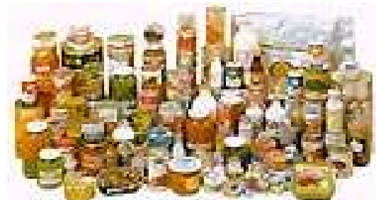
Autoklav und Lebensmittelkonserven

resistenteste der relevanten (Gefährlichkeit und Häufigkeit) Keime das Bakterium Clostridium Butolinum. Seine Keimzahl muss um den Faktor 10^{-6} bis 10^{-8} reduziert werden. Auf der anderen Seite soll das wichtigste der Temperatur anfälligen Nährstoffe – das Vitamin Thiamin – erhalten werden.