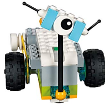
Lego WeDo 2