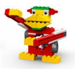
Lego WeDo 1