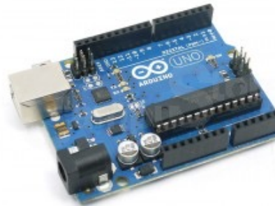
Arduino Starter Kit